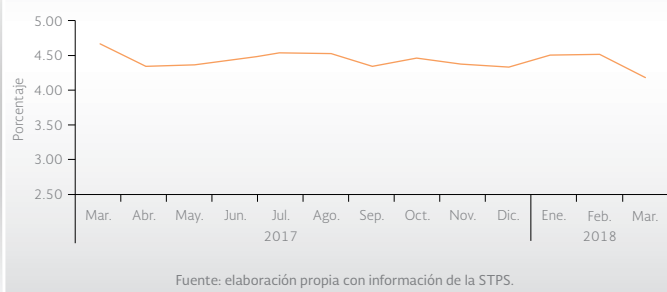
Gráfica 2. Variación del número de trabajadores afiliados al IMSS, marzo de 2017 a marzo de 2018

En marzo de 2018, el número total de asegurados al IMSS fue de 19.79 millones de personas, cifra que representó un incremento de 4.17% respecto a la registrada en marzo del año pasado. El número de asegurados aumento en 90,509 personas, lo que significó una variación de 0.46% con respecto al mes inmediato anterior. Por otra parte, del total de personas ocupadas en el mes de referencia, 16.9 millones eran ocupados permanentes y 2.89 millones de personas eran eventuales (ver gráfica 2).