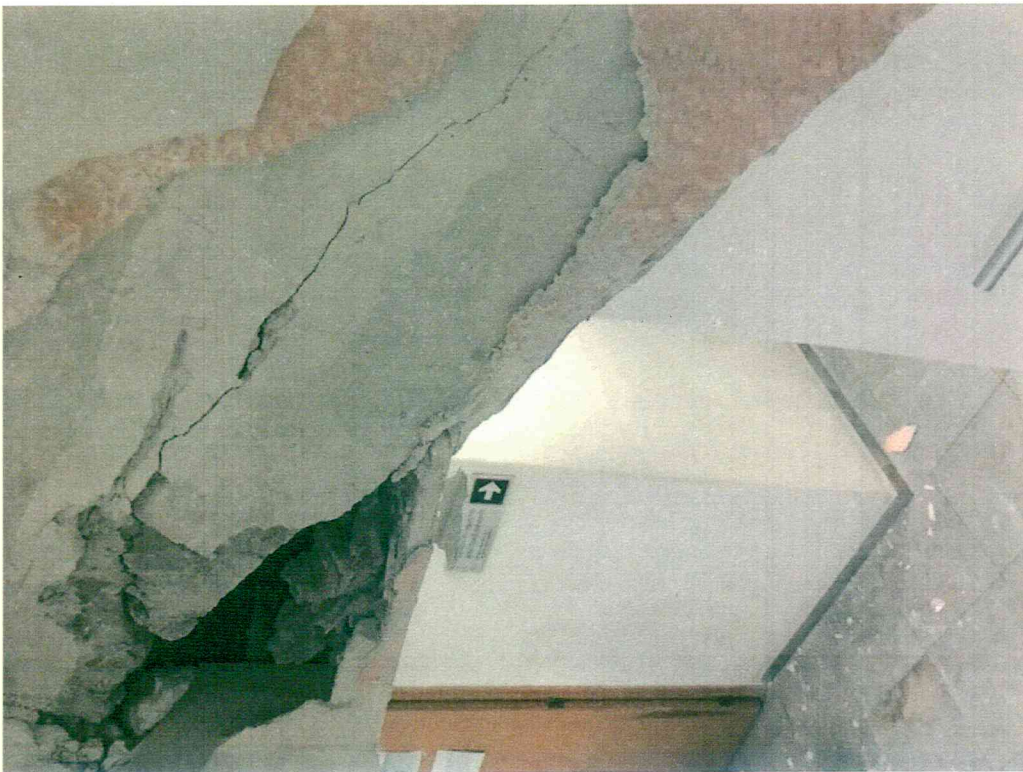
FOTO 6. FALLA DE ESCALERA RECURRENTE. SUBSANAR LA CAUSA.