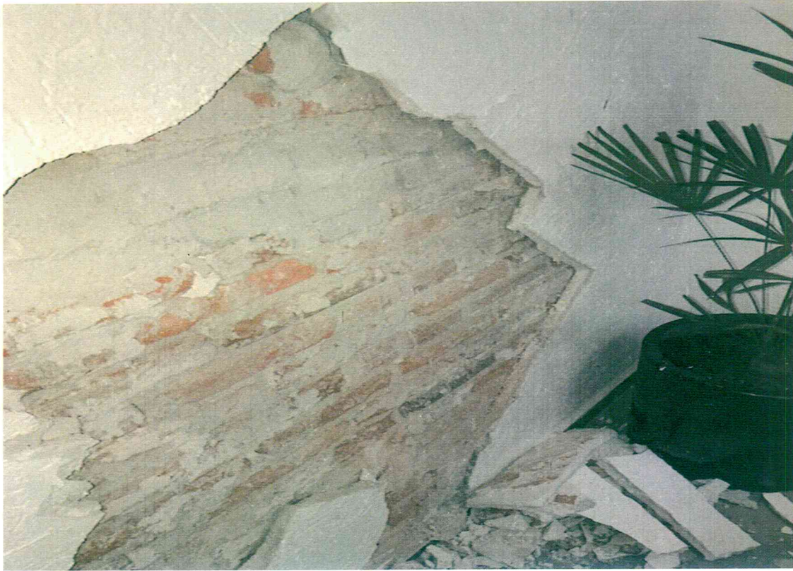
FOTO 3. DESPRENDIMIENTO DE YESO EN COLINDANCIA NORTE. MUY GRUESO.