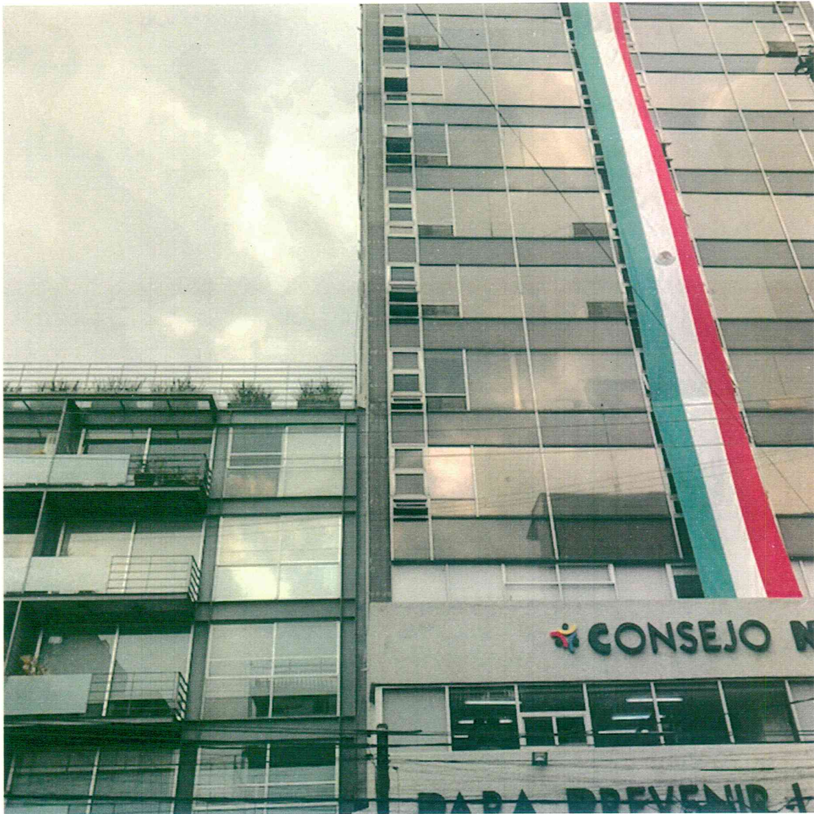
FOTO 2. VISTA DE COLINDANCIA NORTE. NO SE OBSERVA DESPLOME. FACHADA SIN DESPRENDIMIENTOS. SIN VIDRIOS ROTOS.