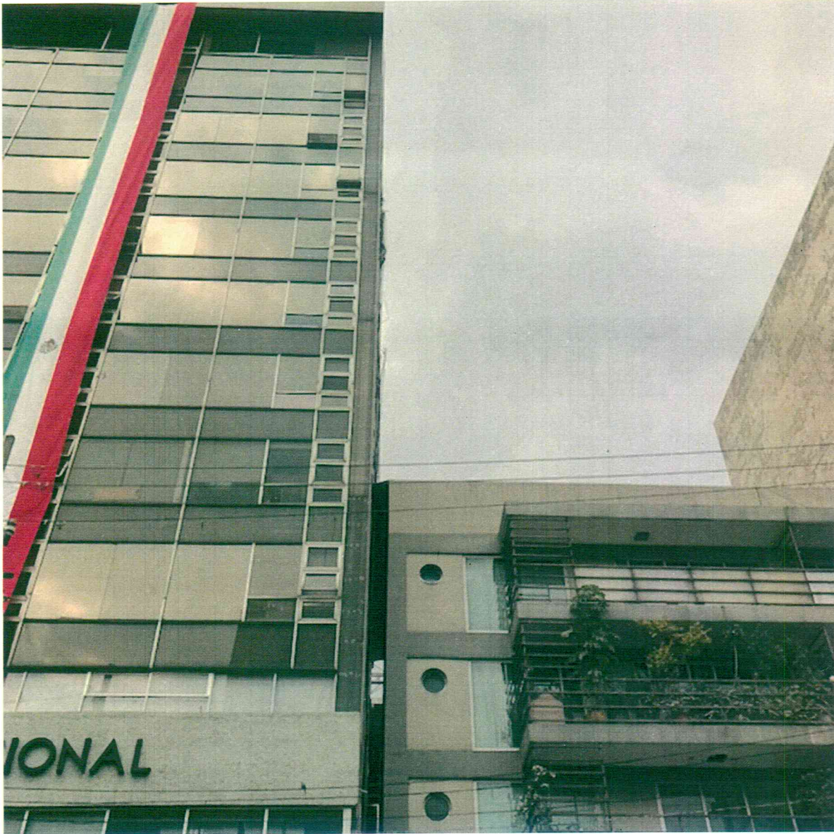
FOTO 1. VISTA DE COLINDANCIA SUR. NO SE OBSERVA DESPLOME. FACHADA SIN DESPRENDIMIENTOS. SIN VIDRIOS ROTOS.

A blue ink signature, likely of a professional, written in a cursive style.