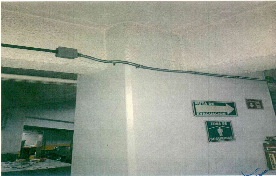
FOTO 4. COLUMNA Y TRABES DE P.B. CON LOSA MACIZA.