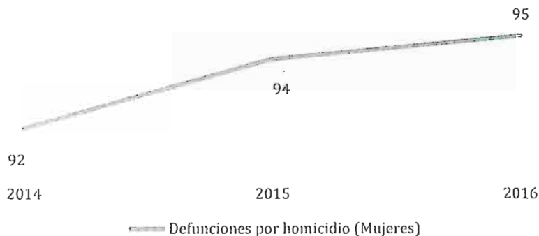
Defunciones de mujeres por homicidio en Puebla