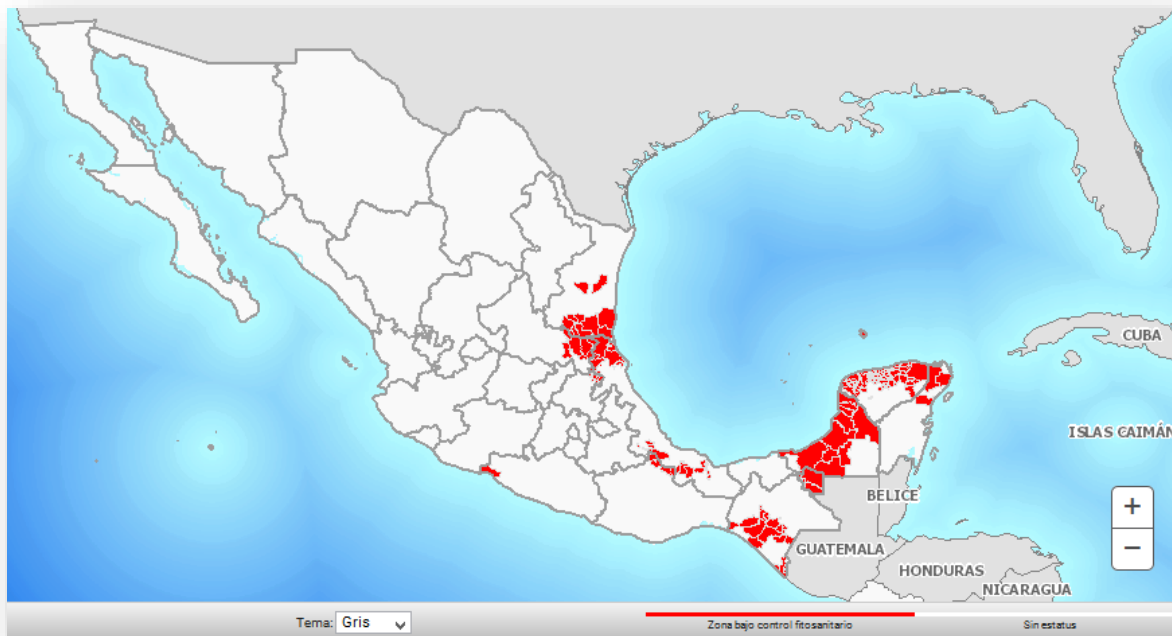
Figura 1. Municipios con presencia de langosta al mes de marzo de 2018.

En el mes de marzo de 2018 mediante la acción de exploración se atendió una superficie de 64,626 hectáreas, de las cuales fue necesario muestrear 4,496 hectáreas acumuladas en los estados de Campeche, Chiapas, Hidalgo, Oaxaca, Quintana Roo, San Luis Potosí, Tabasco, Tamaulipas, Veracruz y Yucatán (Figura 1), registrándose un promedio de infestación de 5 individuos/100 m 2 .