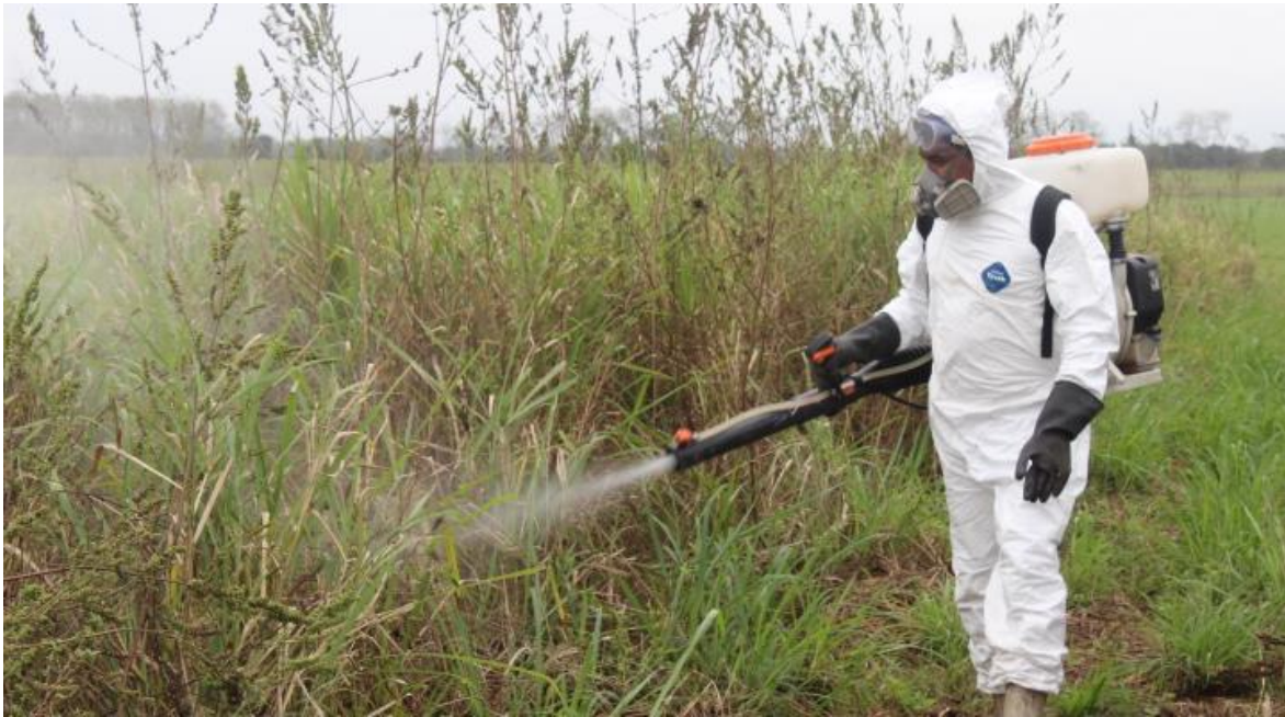
Figura 1. Control químico ante la presencia de langosta adulta (solitaria), Oaxaca.

Al llevar a cabo las acciones de la campaña en 10 Entidades Federativas, se protegió indirectamente la superficie establecida con cultivos de agave, calabaza, caña de azúcar, cártamo, cítricos, frijol, frutales, girasol, limón, maíz, mango, naranja, palma de aceite, piña, sorgo, soya, teca y tomate de cáscara, principalmente, pues la langosta es un insecto polífago que puede llegar a alimentarse de hasta 400 especies vegetales. Mediante la detección y control oportuno, la plaga en cuestión no representó riesgo de daño o pérdidas económicas, que pueden llegar a ser de hasta el 100% de los cultivos susceptibles (Figura 1).