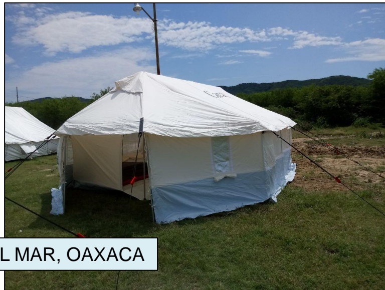
SAN DIONISIO DEL MAR, OAXACA