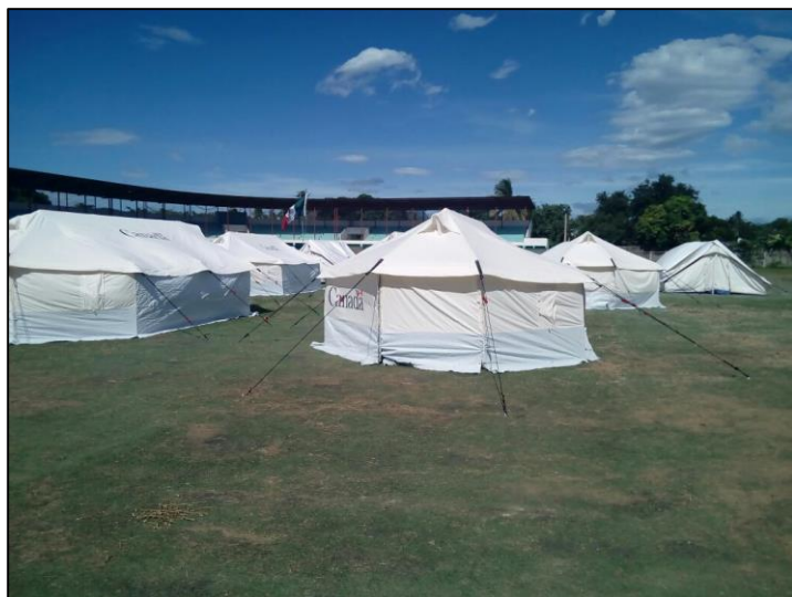
TEHUANTEPEC, OAXACA (CAMPO LA AGRICULTURA)