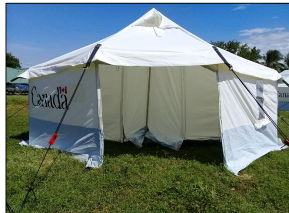
SAN FRANCISCO IXHUATÁN, OAXACA