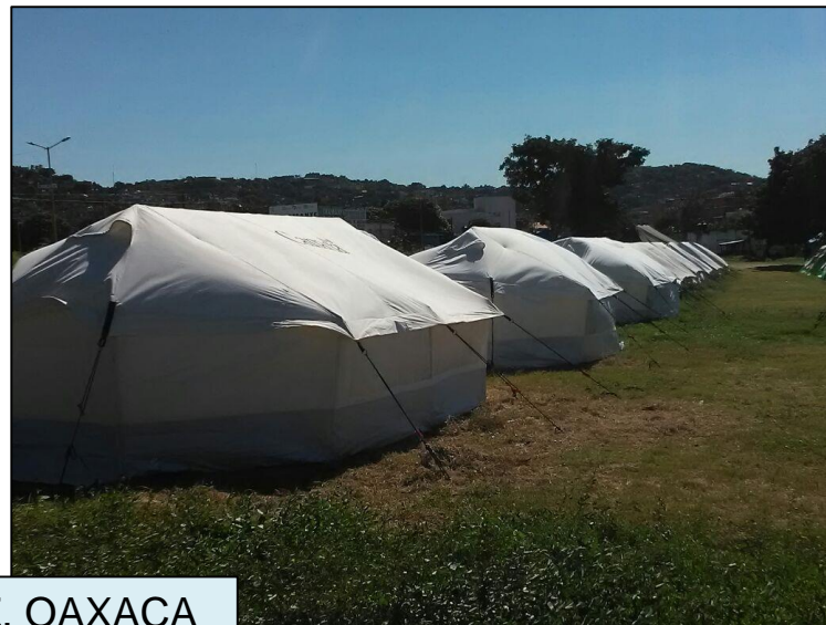
SALINA CRUZ, OAXACA CAMPO "EL BLANQUITO"