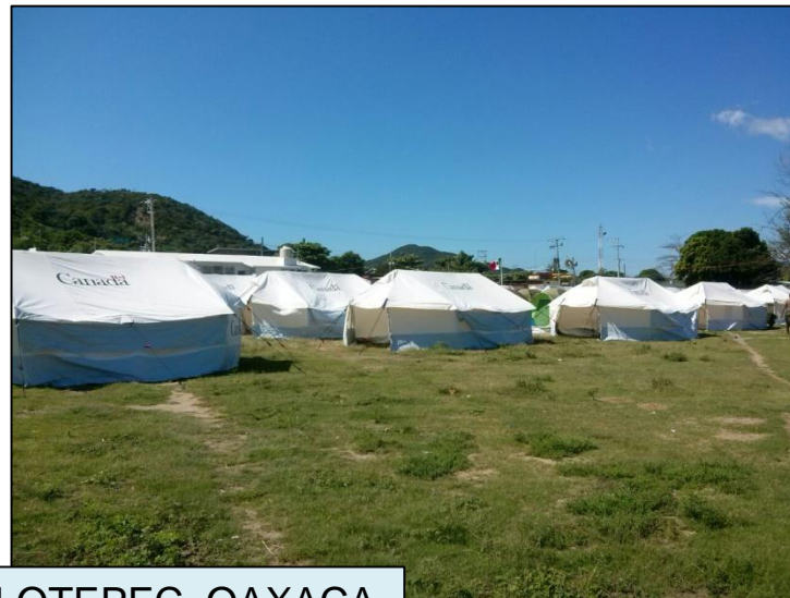
SAN PEDRO HUILOTEPEC, OAXACA