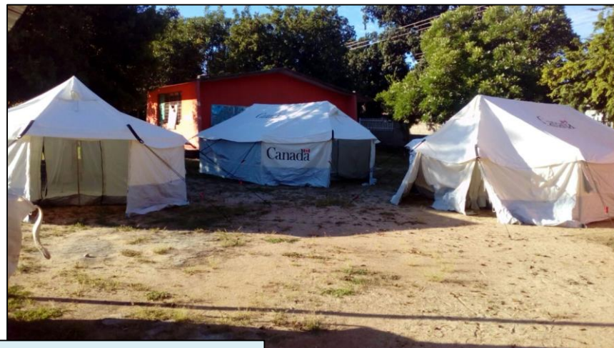
SANTA MARÍA HUAMELULA, OAXACA