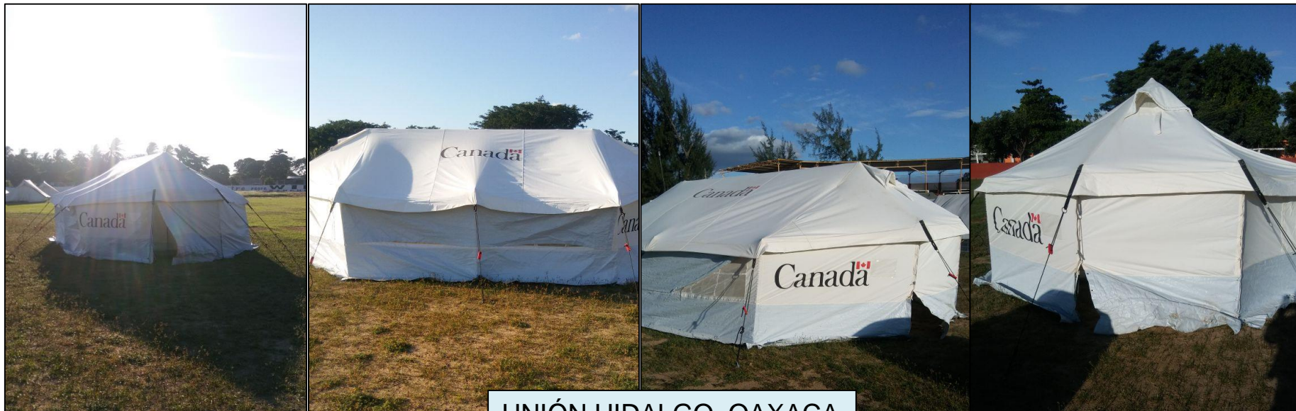
UNIÓN HIDALGO, OAXACA