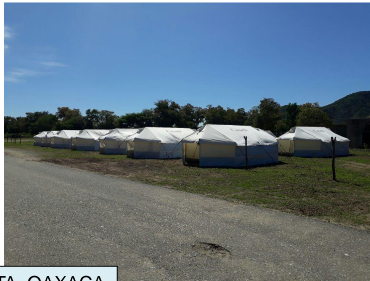
SANTIAGO ASTATA, OAXACA