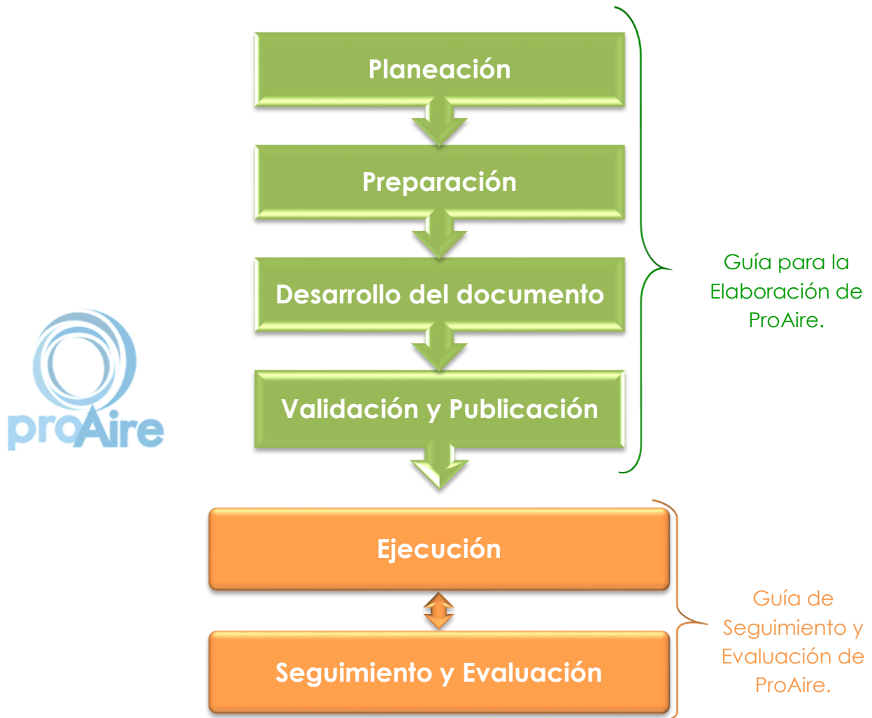
Figura 1. Etapas de un ProAire

El desarrollo de un ProAire consta de seis etapas, las cuales son: Planeación, Preparación, Desarrollo del documento, Validación y Publicación, Ejecución y Seguimiento y Evaluación.