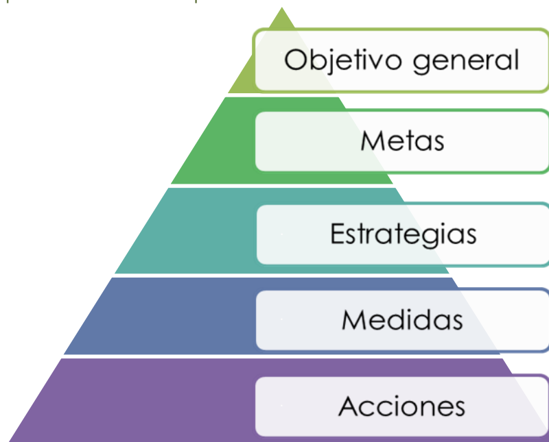
Figura 3. Jerarquización de conceptos