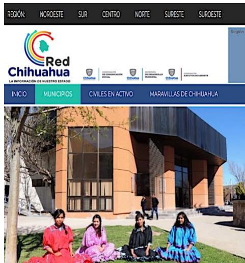
UPNECH difunde oferta educativa en campus Creel

CHIHUAHUA (20/mar/2018). La Universidad Pedagógica Nacional del Estado de Chihuahua (UPNECH), campus Creel, presentó su oferta académica a las y los alumnos de la escuela preparatoria 8413 “José Vasconcelos”.