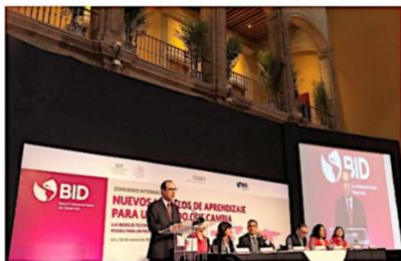
CIUDAD DE MÉXICO, 14 de marzo (AlmomentoMX).- Al inaugurar el seminario