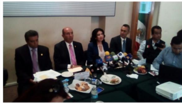
▲ Autor: Aida Espinosa / UrbisTV | Publicado: 14 de Marzo de 2018 a las 14:55:00

MICHOCÁN (14/mar/2018). La Secretaría de Educación Pública (SEP), destinará más de 930 millones de pesos a Michoacán, para la ejecución de la Reforma Educativa, a través de programas del INEA, CONAFE y la Secretaría de Educación en el Estado (SEE).