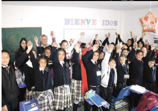
De 2014 a la fecha, han creado 18 nuevas escuelas en la región Tulancingo, en distintos niveles.