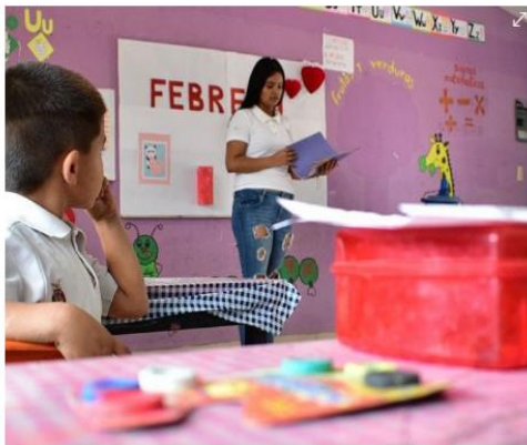
Niños, durante un día de clases.