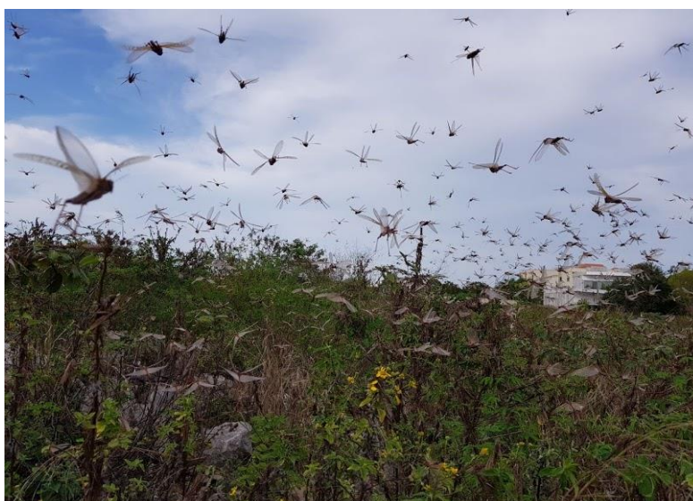
Figura 2. Manga controlada en la Cd. de Mérida, Yucatán