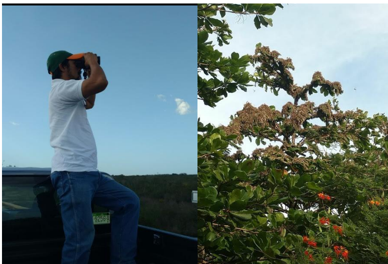
Figura 1. Labores de ubicación y parte de la manga posada, Yucatán.

Al llevar a cabo las acciones de la campaña en 10 Entidades Federativas, se protegió indirectamente la superficie establecida con cultivos de agave, calabaza, caña de azúcar, cártamo, cítricos, frijol, frutales, girasol, limón, maíz, mango, naranja, palma de aceite, piña, sorgo, soya, teca y tomate de cáscara, principalmente, pues la langosta es un insecto polífago que puede llegar a alimentarse de hasta 400 especies vegetales. Mediante la detección y control oportuno, la plaga en cuestión no representó riesgo de daño o pérdidas económicas, que pueden llegar a ser de hasta el 100% de los cultivos susceptibles (Figura 1 y 2).