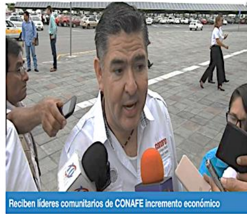
Reciben líderes comunitarios de CONAFE incremento económico

Señaló que los líderes comunitarios de 2 años en servicio, recibían 2 mil 713 pesos, mientras que en este año recibirán 3 mil 200 pesos, con un incremento de 547 pesos y un porcentaje de un 20% de incremento.