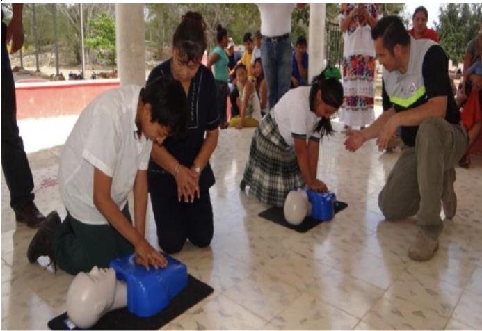
Alumnos practican la reanimación cardiopulmonar con un maniquí