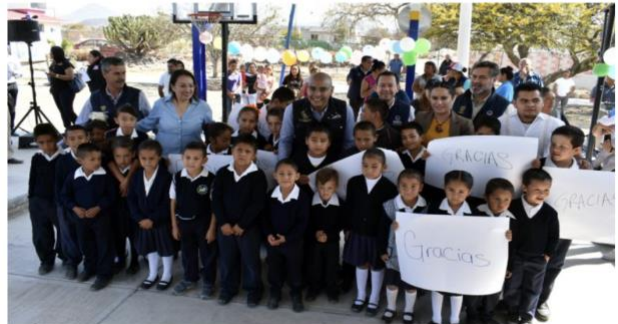
Entregan infraestructura de primaria en la capital