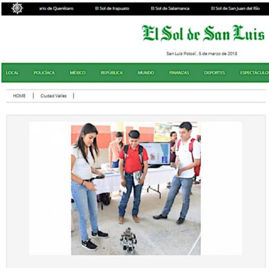
Un éxito la feria Profesiográfica organizada por el ayuntamiento

SAN LUIS POTOSÍ (5/mar/2018). Con la participación de más de una docena de instituciones educativas y la asistencia de más de un centenar de estudiantes, se realizó con éxito la Tercera Feria Profesiográfica, en la que mostró a los jóvenes la gama de opciones de algunas instituciones para que continúen con sus estudios.