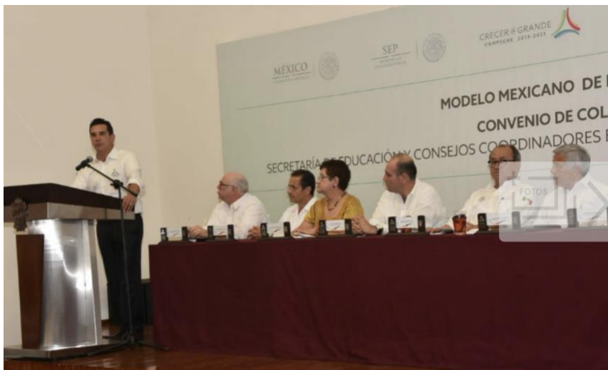
Reconocen labores de figuras educativas y promotores del Conafe | recomendada

El mandatario de Campeche pidió a los más de 900 líderes educadores comunitarios y promotores de educación inicial que continúen trabajando en la construcción de un estado más incluyente