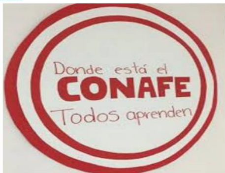
Incrementos en las aperturas asistenciales a 40 mil 000 niños indígenas y profesores del Conafe. En marcha la Segunda Cruzada Nacional por la Educación Comunitaria en beneficio de 700 mil niños de comunidades indígenas, rurales y suburbanas. Fuente: SEP

3 marzo 2018 - Educación - Tagged: SEP-DEFENDER EL AVANCE DE LA REFORMA EDUCATIVA, Y LA LABOR SOCIAL DEL CONAFE - no comentarios