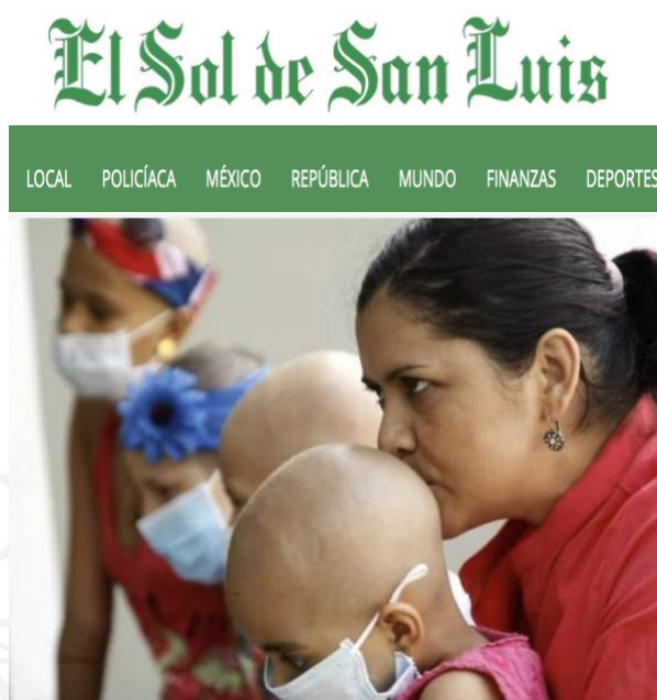
Invitan a docentes a participar en curso de detección oportuna de cáncer infantil

SAN LUIS POTOSÍ (7/feb/2018). Con la finalidad de implementar acciones en las escuelas que permitan la detección temprana y coadyuvar a un oportuno tratamiento para combatir el cáncer infantil, la delegación federal de la Secretaría de Educación Pública en la entidad (SEP) y la Secretaría de Educación de Gobierno del Estado (SEGE) invitan a los profesores potosinos de los niveles de primaria, secundaria y bachillerato a participar en el programa de becas que ofrece la Fundación InterAmericana del Corazón, México, con las que podrán acceder a un curso en línea que proporciona herramientas para la detección temprana de síntomas y signos de sospecha de este mal.