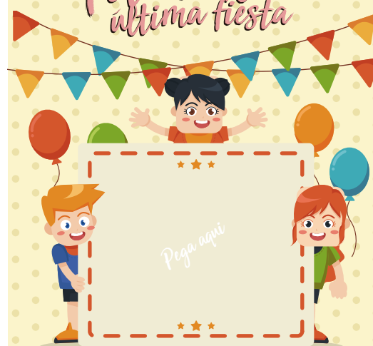
Foto de la última fiesta

En el caso de un o una recién nacida, tómale una fotografía del rostro al menos cada semana hasta que cumpla seis meses de edad, sin usar flash, para no afectar sus ojos, después tómale una foto cada mes.