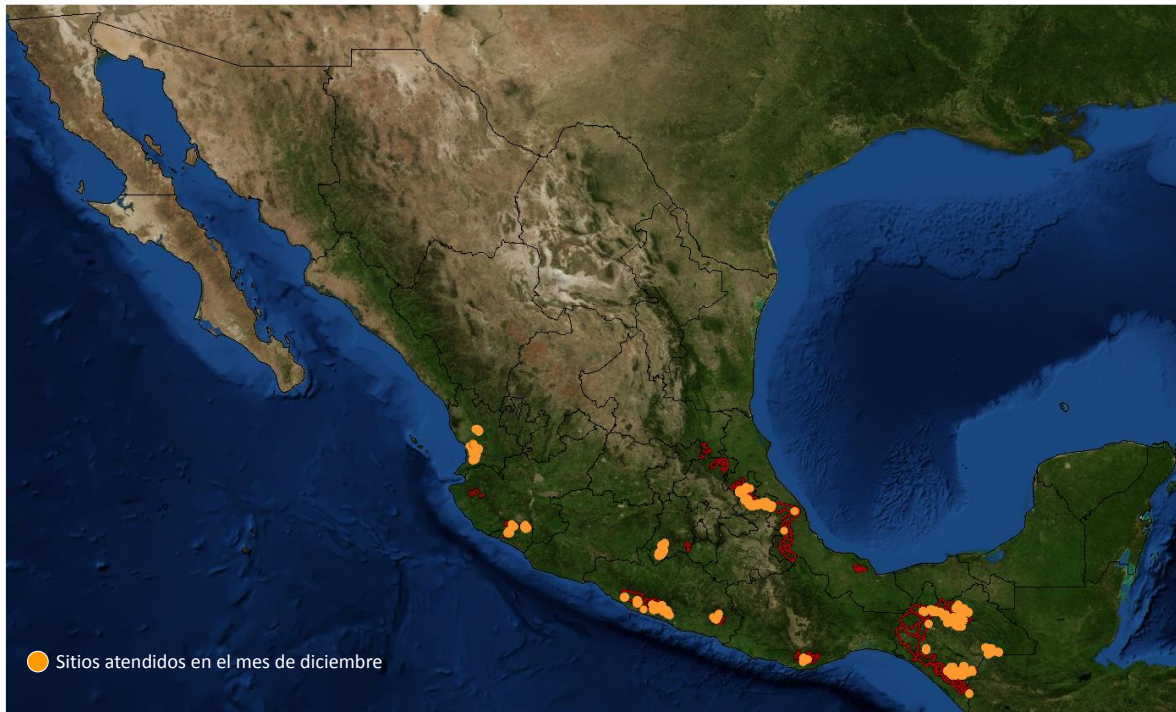
Figura 3. Sitios atendidos con acciones de control en el mes de diciembre en los estados de Chiapas, Colima, Nayarit, Guerrero, Puebla y Veracruz.

Responsable de elaboración: Ing. Félix Martínez Salazar