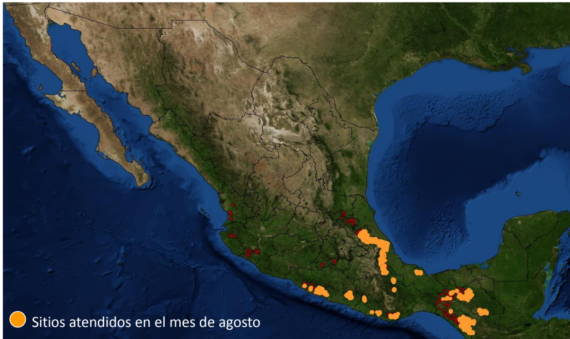
Figura 3. Sitios atendidos con acciones de control en el mes de agosto en los estados de Chiapas, Guerrero, Oaxaca, Puebla y Veracruz.

Responsable de elaboración: Ing. Félix Martínez Salazar