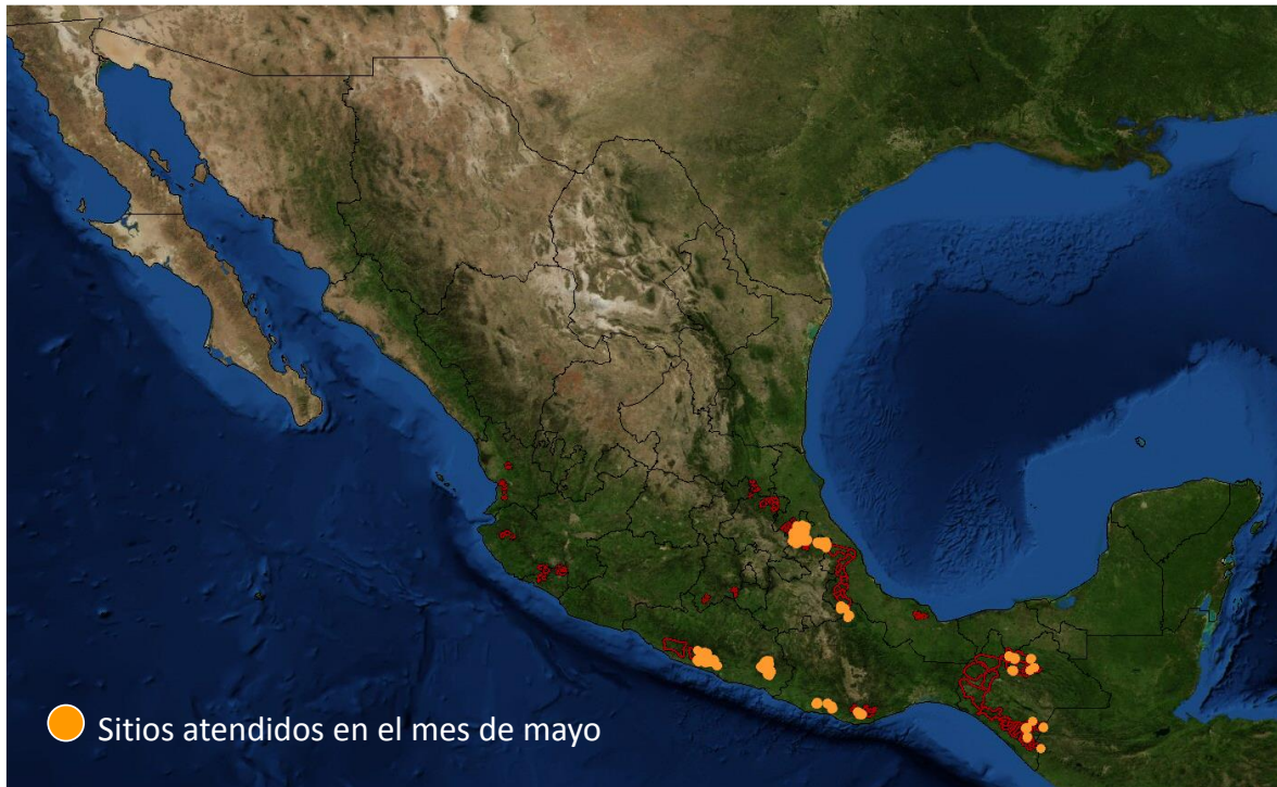
Figura 3. Sitios atendidos con acciones de control en el mes de mayo en los estados de Chiapas, Guerrero, Oaxaca, Puebla y Veracruz.

Responsable de elaboración: Ing. Félix Martínez Salazar