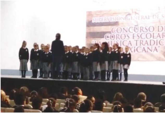
LA ESCUELA Juan Escutia, de Santiago Tulantepec, obtuvo el segundo lugar en el concurso La Música Tradicional Mexicana, en la fase de sector. Los alumnos participantes no solo deseaban ganar, también conocer el centro de Tulancingo.

HIDALGO (22/ene/2017). Alumnos de una escuela de Santiago Tulantepec obtuvieron segundo lugar en el concurso “La Música Tradicional Mexicana” y, su mayor anhelo, no solo era ganar uno de los primeros lugares, también conocer el centro de Tulancingo, lo que se les concedió.