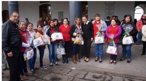
General Entregan paquetes de útiles escolares a profesoras de CONAFE. 15 Enero, 2018

INICIO GENERAL POLÍTICA COLUMNAS DEPORTES POLICIA CONTACTOS