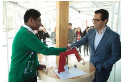
El Secretario de Educación Pública del Estado de Tlaxcala, Manuel Camacho Higareda, informó que aún no hay garantía para la entrega de uniformes gratuitos a los beneficiarios.