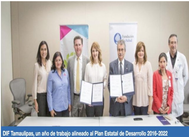
DIF Tamaulipas, un año de trabajo alineado al Plan Estatal de Desarrollo 2016-2022

TAMAULIPAS (8/ene/2018). Con la finalidad de tener un organismo más cercano y más humano, orientado a transformar la vida de las familias y a solucionar los problemas desde la raíz, el Sistema para el Desarrollo Integral para la Familia de Tamaulipas que preside Mariana Gómez de García Cabeza de Vaca, cumplió un año de esfuerzos compartidos con la sociedad en general, apegados al Plan Estatal de Desarrollo 2016-2022, que fue presentado en su momento y es la base del Gobierno de Francisco García Cabeza de Vaca.