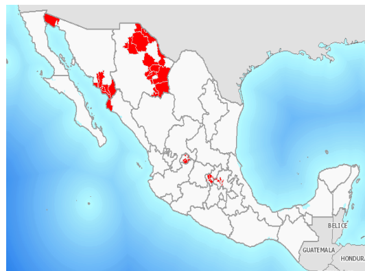
Fig. 1. Presencia de la maleza reglamentada Cuscuta indecora , diagnosticada a nivel nacional.

*Se enlistan las malezas de acuerdo a la cantidad de superficie infestada al mes.