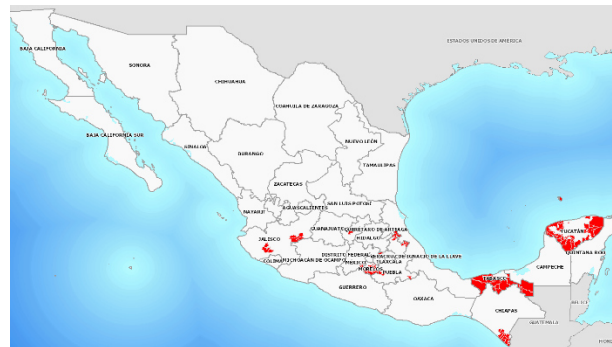
Fig. 1. Presencia de la maleza reglamentada Rottboellia cochinchinensis diagnosticada a nivel nacional.

*Se enlistan las malezas de acuerdo a la cantidad de superficie infestada.