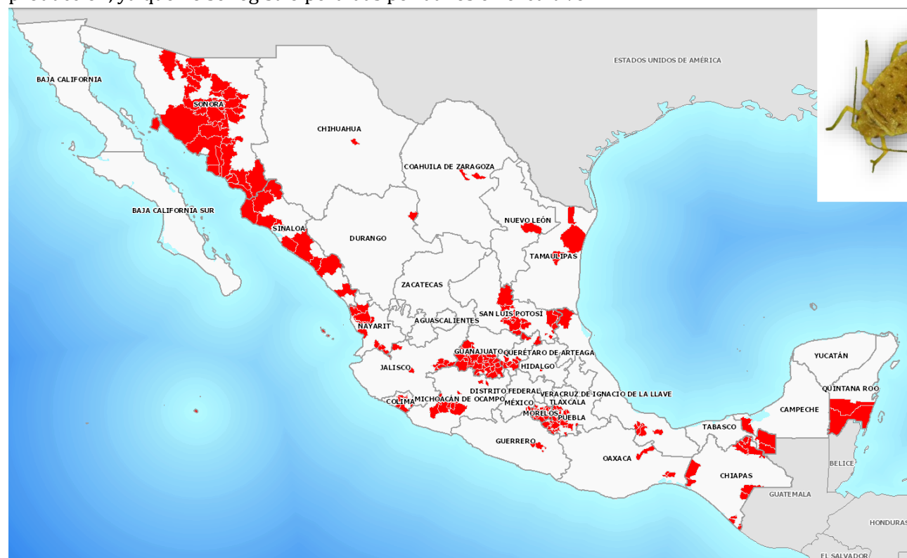
Figura 1. Distribución del pulgón amarillo del sorgo en el territorio nacional.

El pulgón amarillo ( Melanaphis sacchari ), es una plaga de reciente introducción a México. Debido a su alta capacidad de dispersión y elevado potencial de reproducción se ha establecido en prácticamente todo el territorio nacional, afectando principalmente al cultivo del sorgo. En el ejercicio 2016, se implementó un esquema de manejo integrado, obteniéndose resultados muy favorables en el manejo de la plaga y en la producción, ya que no se registró pérdidas por daños en el cultivo.