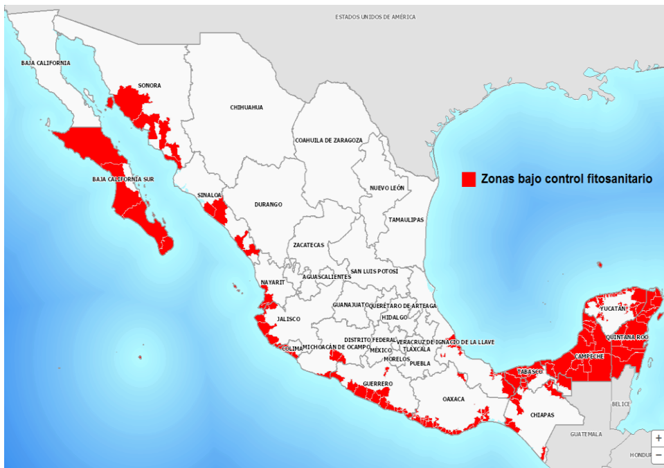
Figura 1. Estatus fitosanitario del ácaro rojo de las palmas al mes de noviembre de 2017.

Al mes de noviembre el ácaro rojo se ha distribuido en 190 municipios de los estados de Campeche, Baja California Sur, Colima, Chiapas, Guerrero, Jalisco, Michoacán, Nayarit, Oaxaca, Sinaloa, Sonora, Tabasco, Quintana Roo, Veracruz y Yucatán, entidades en las cuales la plaga se reporta únicamente en 6,367 hectáreas dedicadas a la producción comercial de cocotero, plátano y palmas ornamentales, lo cual representa el 2.1% de la superficie agrícola establecida a nivel nacional (Fig. 1).