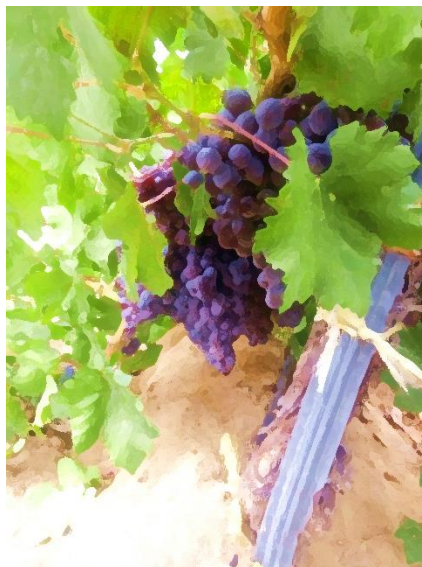
Figura 2. Racimo de vid, Municipio de Parras de la Fuente, Coahuila, 2017.

La erradicación de X. fastidiosa resulta muy difícil debido a que es una bacteria sistémica, a que tiene un amplio rango de huéspedes, un gran número de insectos vectores, y a que son frecuentes las infecciones latentes (asintomáticas).