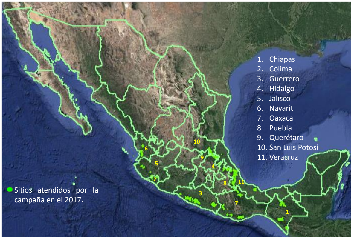
Figura 3. Estados y sitios atendidos por la campaña contra la broca del café en el 2017.

Responsable de elaboración: Ing. Félix Martínez Salazar