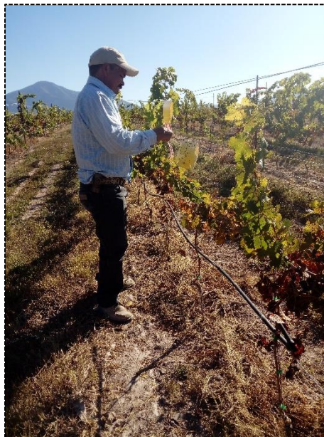
Ilustración 1. Revisión de trampas dirigidas a vectores de la enfermedad de Pierce.

Durante el mes de septiembre, se colectaron 6 muestras vegetales en los estados de Querétaro que presentaron sintomatología de la enfermedad, las cuales, se encuentran en proceso de diagnóstico. Lo anterior, con el objetivo de corroborar la presencia de la bacteria Xylella fastidiosa subsp. fastidiosa .