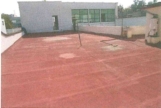
Foto 7. Losa plana de azotea, sin afectaciones estructurales.