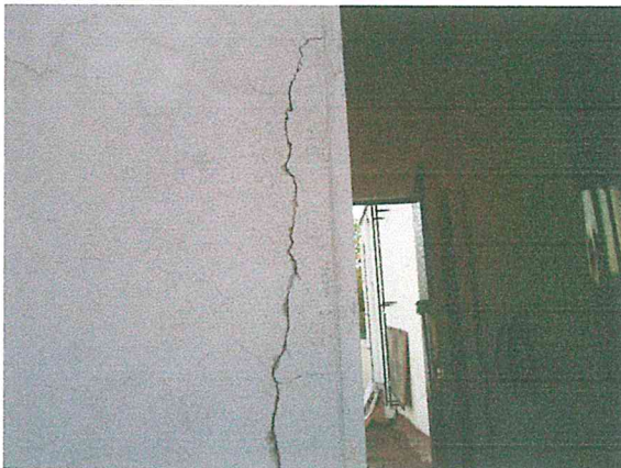
Foto 9. Fisura en el aplanado de un muro, misma que no representa riesgo estructural, sin embargo se recomienda su sellado.