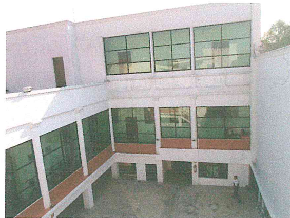
Foto 4. Fachada interior del cuerpo del fondo de dos niveles, sin afectaciones estructurales.