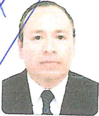
FIRMA DEL DIRECTOR RESPONSABLE DE OBRA