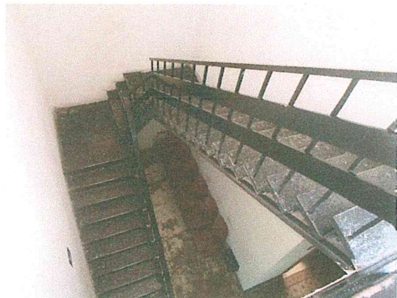
Foto 13. Se observa que en la azotea hay una construcción ajena al edificio original. Se recomienda hacer un análisis de la carga que representa, para evaluar el riesgo estructural que podría representar. Foto 14. Escalera de estructura metálica, en buen estado estructural.

Atentamente Arq. Tarsicio Vega González DRO # 2030 Cedula Profesional 1927535