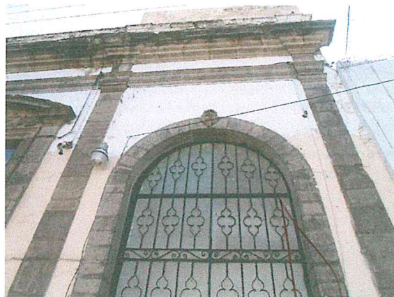
Foto 1 y 2. Fachada principal construida en 1901, en buen estado estructural.