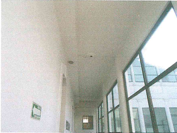
Foto 5. Muros, columnas y losa del pasillo, sin afectaciones estructurales.