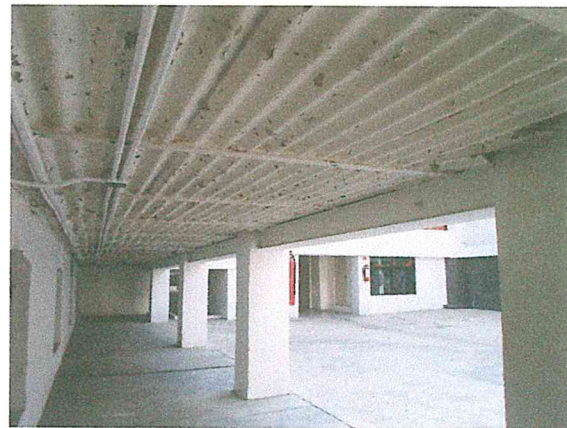
Foto 8. Sistema de entepiso del sótano a base de viga y lámina, sin afectaciones estructurales.