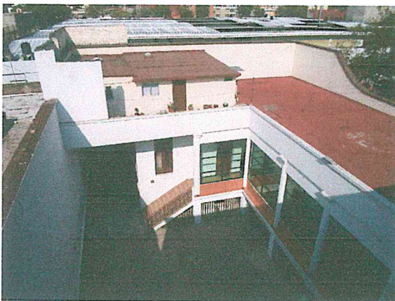
Foto 3. Fachada interior del primer cuerpo en "L" de un nivel, sin afectaciones estructurales.

El sistema estructural es a base muros de carga de mampostería mixta. En las circulaciones hay columnas y travesaños. Los entrepisos y techumbre son de vigueta y lámina y losas planas con vigas.