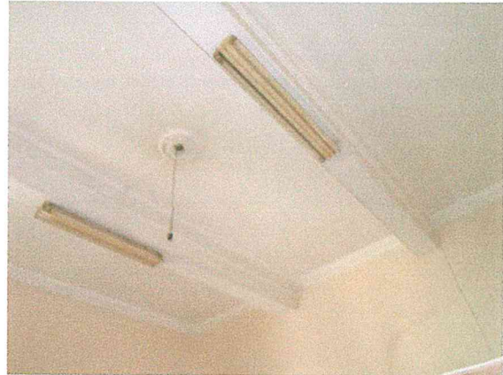
Foto 6. Losa plana y trabes, sin afectaciones estructurales.