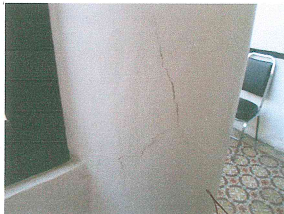
Foto 10. Fisura en el aplanado de una columna, misma que no representa riesgo estructural, sin embargo se recomienda su sellado.