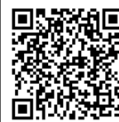
Infografía CENAPRED: "Mar de fondo"