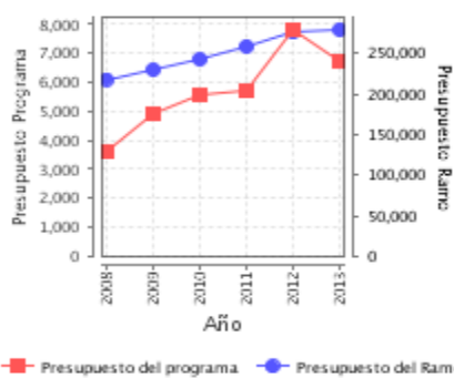
Presupuesto Ejercido Program vs. Ramo