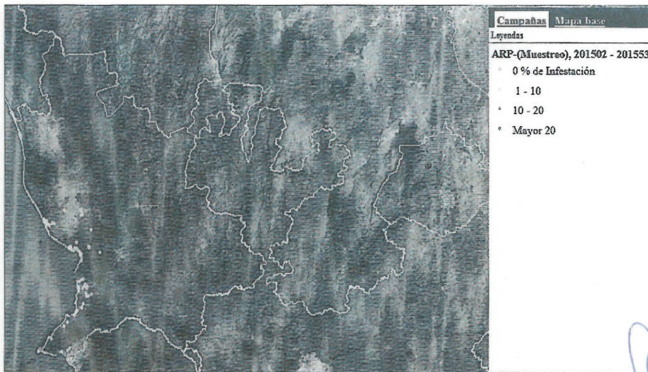
Figura 1. Situación fitosanitaria de Raoiella indica en el estado de Nayarit.

Dentro del municipio de Bahía de Banderas la producción agrícola del cocotero se destina para el consumo de coco de agua, sin embargo; dichas plantaciones son utilizadas en algunos casos para la venta de plantas para ornato ya que siendo una zona turística también se explota este tipo de mercado, así mismo existen diversas plantaciones con palmas de ornato las cuales son afectadas por Raoiella indica , plaga de importancia cuarentenaria oficialmente detectada en septiembre de 2013 en este municipio.