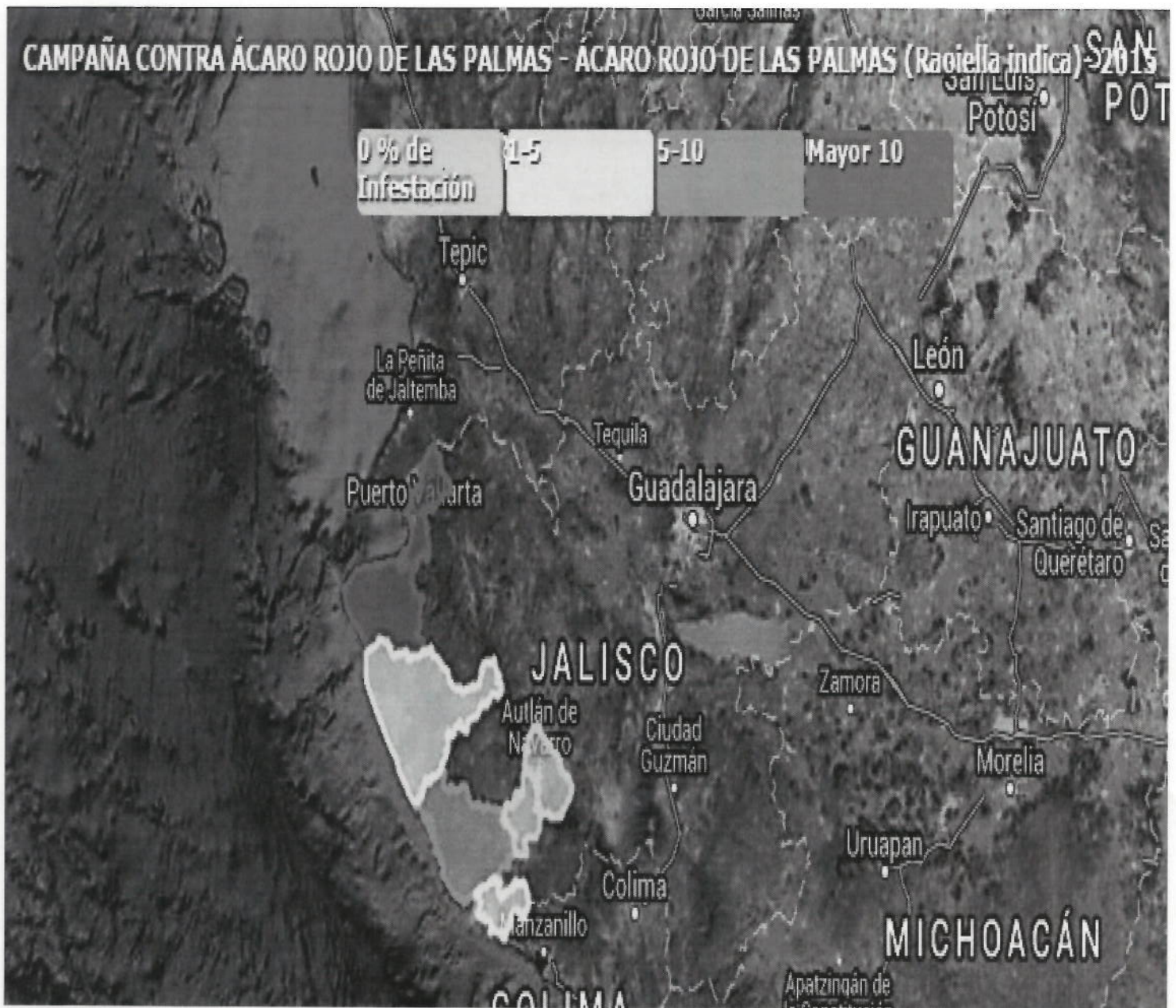
Figura 1. Estatus fitosanitario del Ácaro Rojo de las Palmas, en el estado de Jalisco. Mapa de seguimiento del 2015.

Durante el año 2015, se muestrearon 2,724.57 hectáreas, en los municipios de Puerto Vallarta, Cabo Corrientes, Tomatlán, La Huerta, Cihuatlán y Casimiro Castillo.