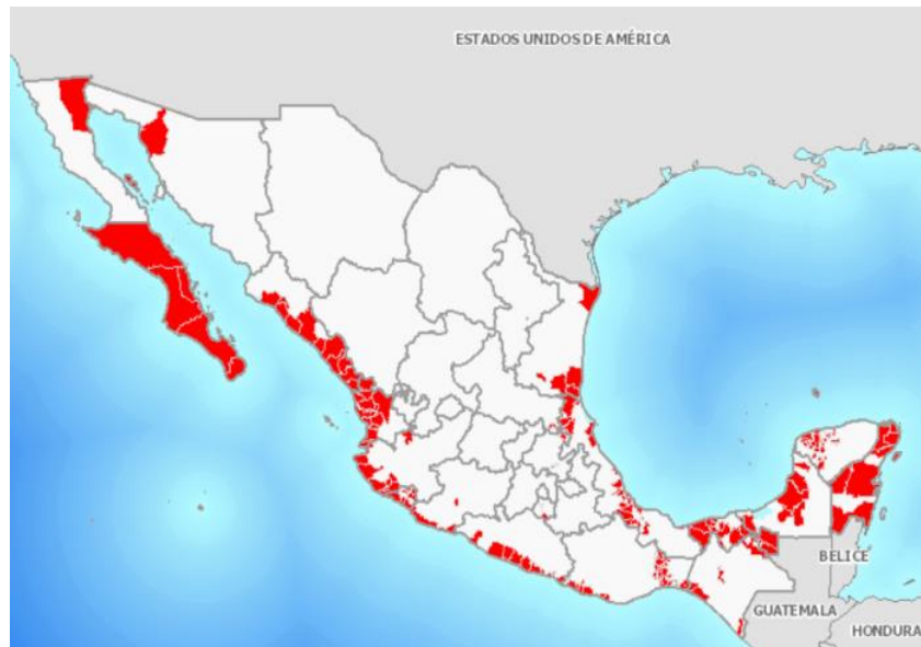
Figura 2. Situación fitosanitaria de la CR, en México.

Al mes de diciembre del 2016, la plaga se encuentra presente en los estados de Baja California, Baja California Sur, Chiapas, Campeche, Colima, Guerrero, Hidalgo, Jalisco, Michoacán, Morelos, Nayarit, Oaxaca, Quintana Roo, 23,081 ha. Cabe mencionar que la cochinilla rosada no ha causado daños en áreas de producción agrícola comercial debido a que su presencia se limita principalmente a áreas urbanas y silvestres. En la Figura 2, se observa el mapa de distribución de la plaga.