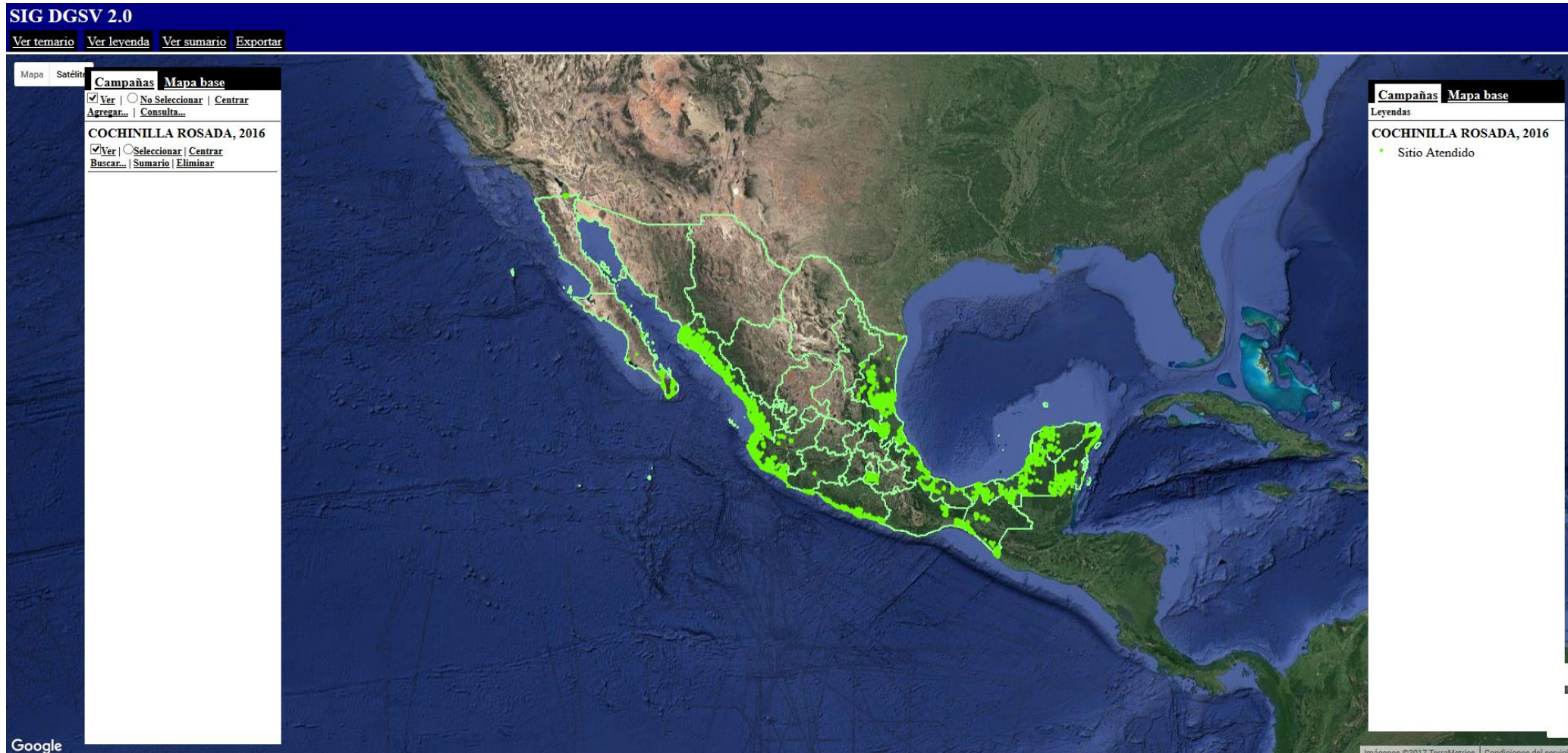
Figura 1: Estados donde se realizó muestreo para la detección de cochinilla rosada