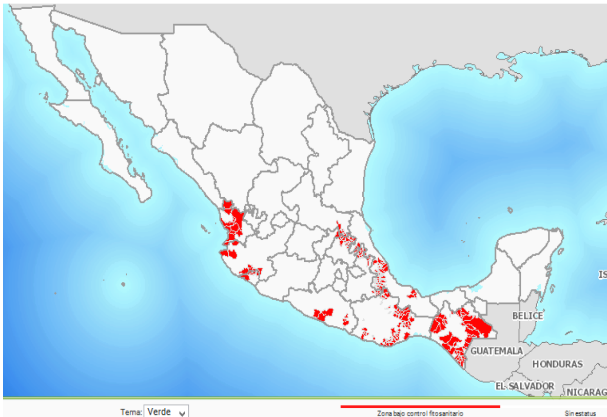
Figura 1. Municipios con antecedentes de la broca del café.

La broca del café se encuentra presente prácticamente en todas las zonas productoras de café del país (Figura 1), no obstante, los niveles de infestación están determinados por las condiciones agroecológicas donde se ubican los predios, así como del manejo agronómico realizado en los mismos, ya que de acuerdo con los datos de muestreo del 2016, el promedio de infestación en los municipios atendidos reflejan infestaciones del 0% (Jalpan de Serra, Qro.) al 12.1% (Tenampa, Veracruz).