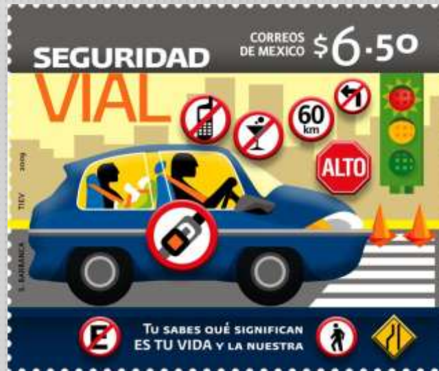
DISTRACTORES PRISA ESTADO DE ANIMO CANSANCIO