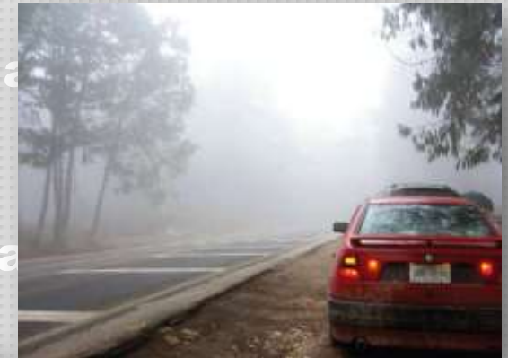
CONDICIONES CLIMÁTICAS y DE LA VÍA