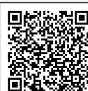
Infografía CENAPRED: "Qué onda con el calor"