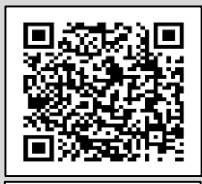
Infografía CENAPRED: "Ciclón acercándose"

AZUL: Alertamiento por conducto de los medios de comunicación masiva sobre el alejamiento del ciclón y la mínima posibilidad de afectación. Conclusión de las tareas de alertamiento sobre el fenómeno particular.