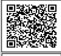
Infografía CENAPRED: "Ciclón alejándose"