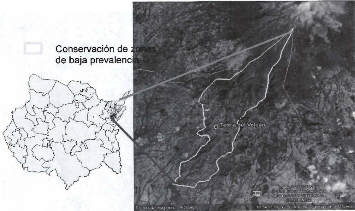
Figura 2. Conservación de áreas de baja prevalencia de moscas de la fruta.