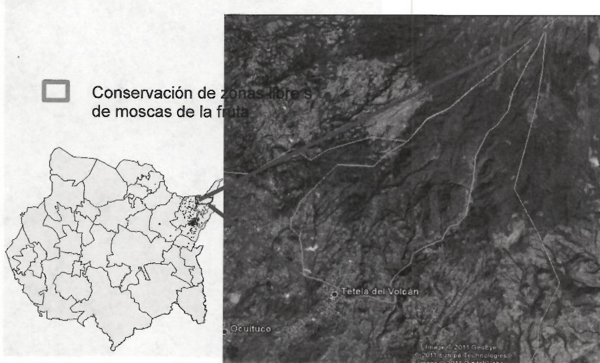
Figura 1. Conservar zonas libres de moscas de la fruta.