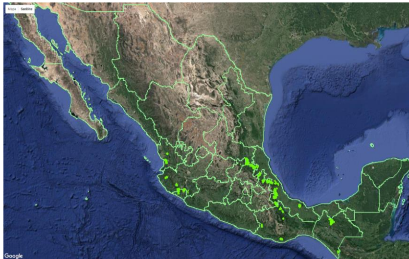
Fig.2. Sitios atendidos durante el año 2016 a nivel nacional en la campaña contra la broca del café.

Como resultado de la implementación oportuna de las medidas fitosanitarias realizadas por personal técnico de la campaña, se ha logrado establecer el trapeo artesanal en una superficie de 21,377 hectáreas de cafetales en once Estados con campaña. Se espera que al final de año se obtenga un menor porcentaje de infestación producto de la acción de las trampas, así mismo, se corroborará con el muestreo de casi el 100% de la superficie programada. El efecto más notable de la efectividad del trapeo es el caso de Querétaro, que actualmente presenta un promedio estatal de 0.03, es decir, un grano brocado por cada 1,000 muestreados. Este porcentaje de infestación no causa daño económico al cultivo.