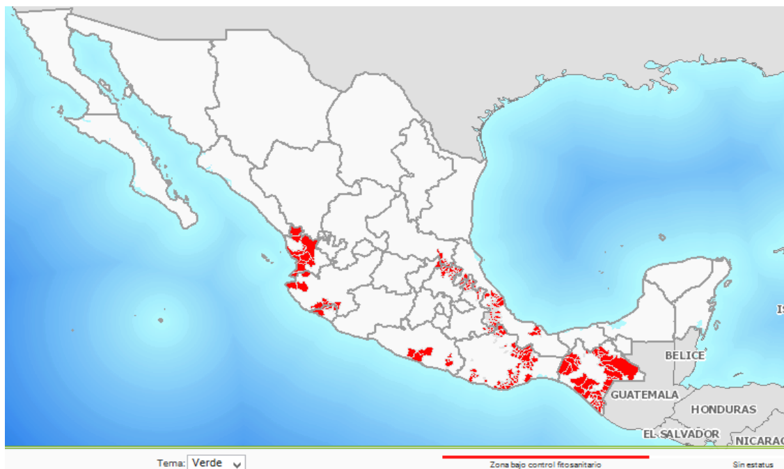
Figura 1. Estatus fitosanitario de los municipios atendidos por la campaña contra la broca del café.

En el mes de febrero de 2016, se continúa con el estatus de zona bajo control fitosanitario en los 81 municipios atendidos por la campaña contra la broca del café (figura 1).