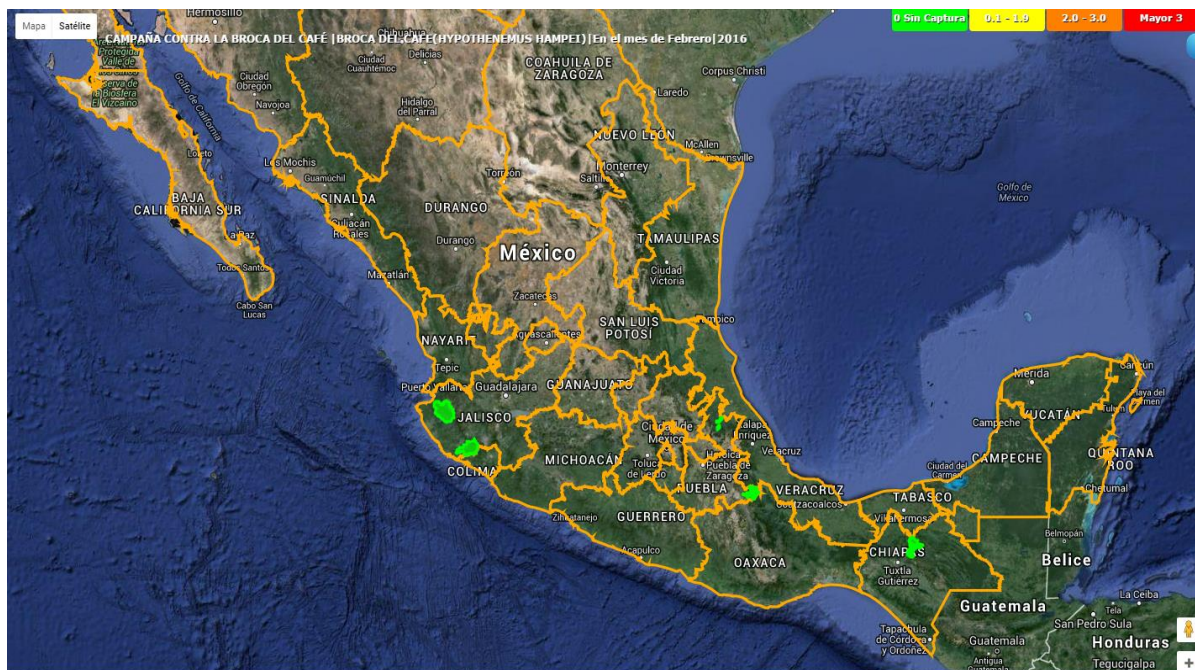
Figura 2. Niveles de infestación de la broca del café.