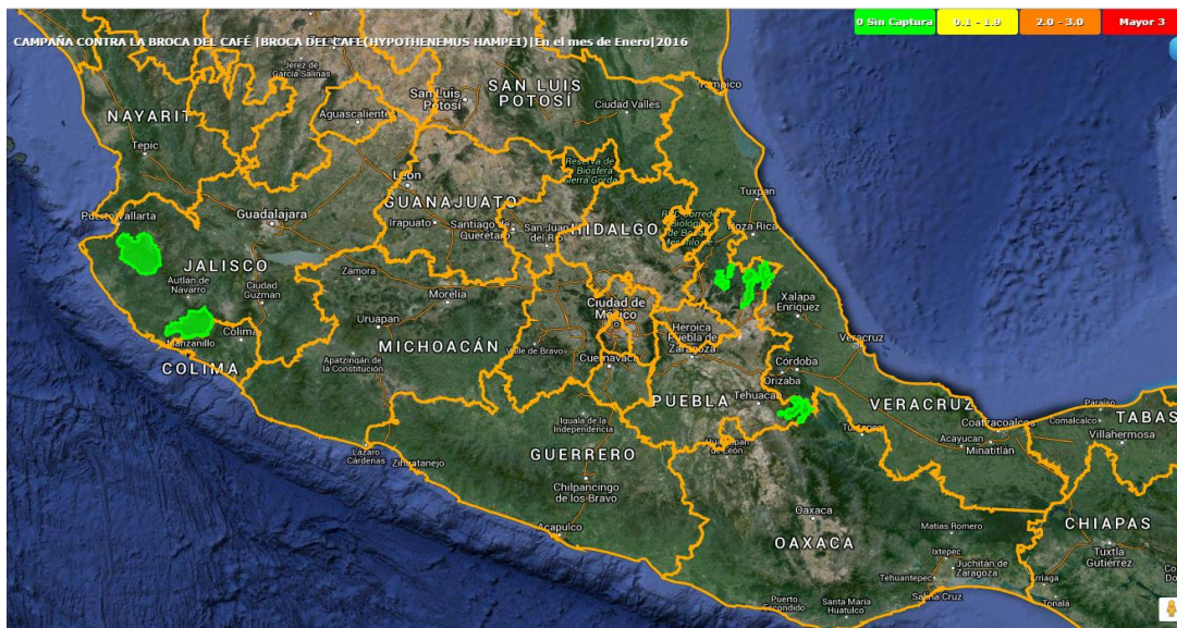
Figura 2. Niveles de infestación de la broca del café.