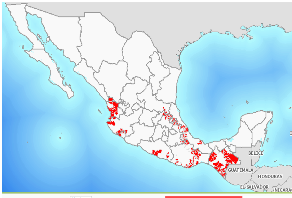
Fig. 1. Situación actual de la campaña contra la broca del café en México.

Al mes de diciembre la broca del café se encuentra presente en los 81 municipios atendidos por la campaña (figura 1). La superficie de trampeo acumulada al mes de noviembre es de 24,292 hectáreas, en las cuales se han instalado 252,110 trampas artesanales. El muestreo del mes anterior registró un nivel de infestación de 1.5%.