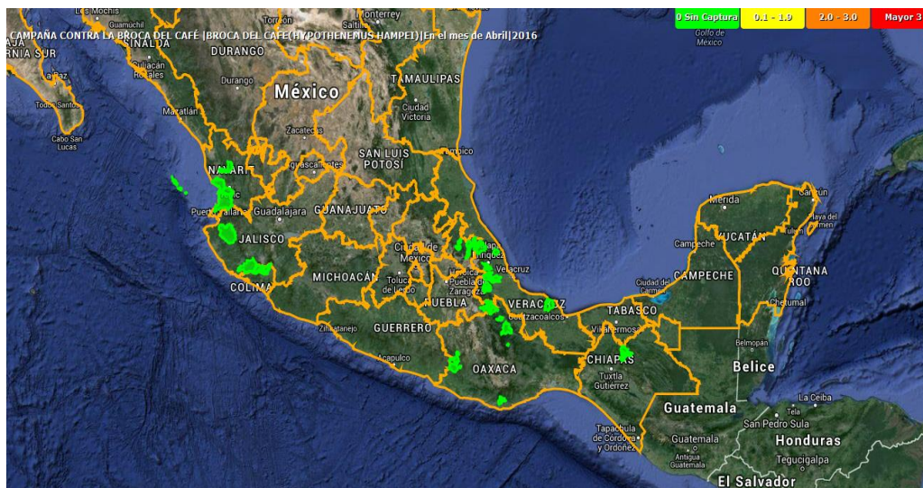
Figura 2. Niveles de infestación de la broca del café.