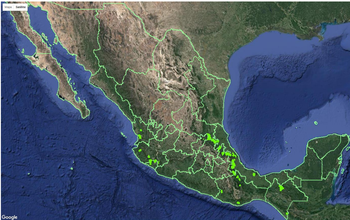
Fig.2. Sitios atendidos durante el año 2016 a nivel nacional en la campaña contra la broca del café.

Como resultado de la implementación oportuna de las medidas fitosanitarias realizadas por personal técnico de la campaña, se ha logrado atender una superficie de 19,870.93 hectáreas instalándose trampas artesanales para el control de la broca del café. El efecto en la reducción de poblaciones se verá reflejado durante los próximos meses, cuando se cuente con el muestreo en todos los sitios atendidos.