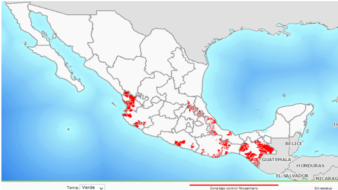
Fig. 1. Situación actual de la campaña contra la broca del café.

En el mes de agosto de 2016, se continúa con el estatus de zona bajo control fitosanitario en los 81 municipios atendidos por la campaña contra la broca del café (Figura 1).