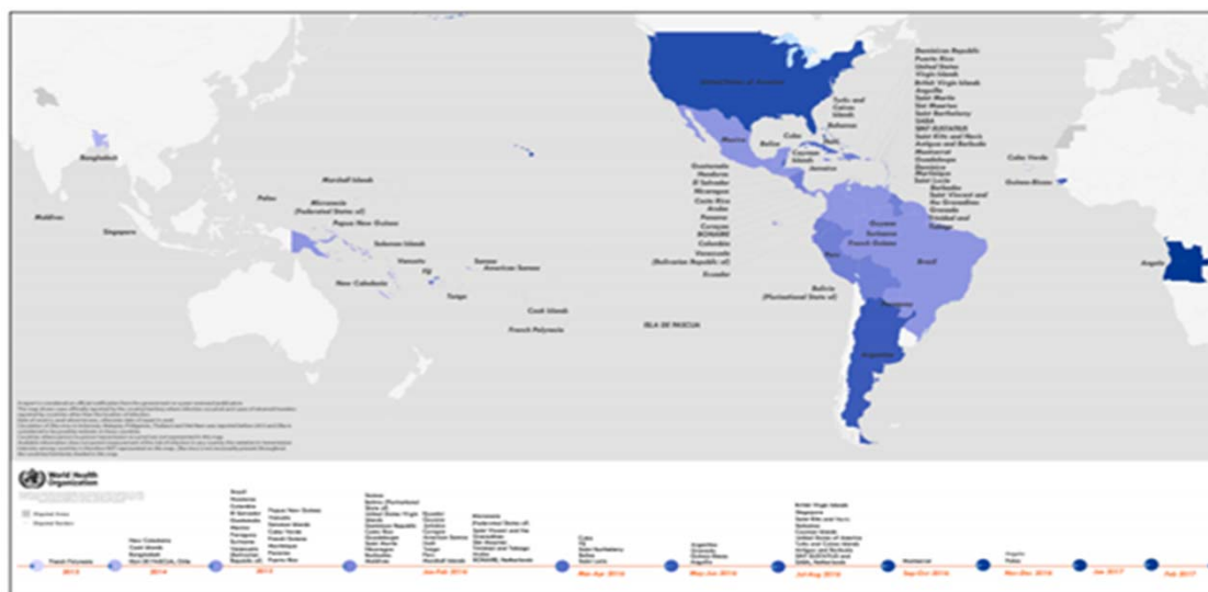
FIGURA 4. DETECCIÓN DE NUEVOS CASOS DE INFECCIÓN VECTORIAL POR EL VIRUS ZIKA, DE ENERO DE 2013 A FEBRERO DE 2017