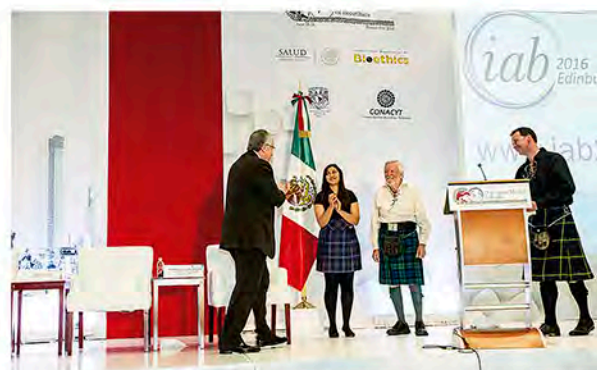
Anuncio de la próxima sede del 13° Congreso Mundial