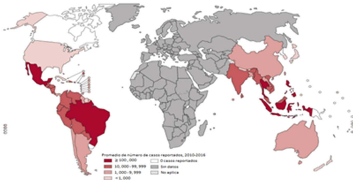
FIGURA 1. DISTRIBUCIÓN MUNDIAL DE DENGUE, 2016