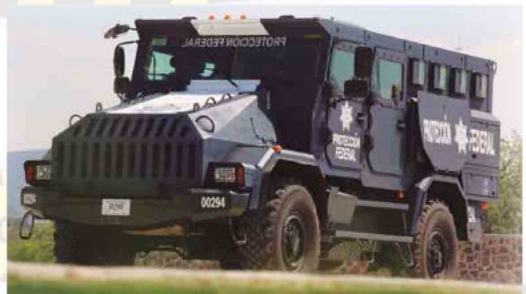
Foto del Mamut